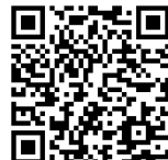
子育て世帯住取得支援事業費