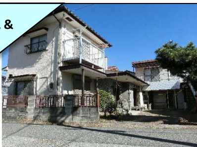
外観 & 1F